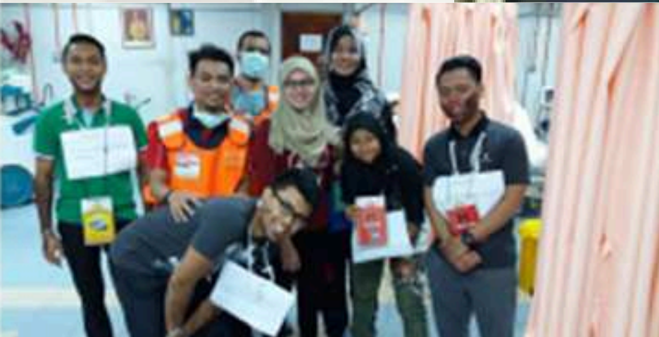
Kursus Basic Life Support