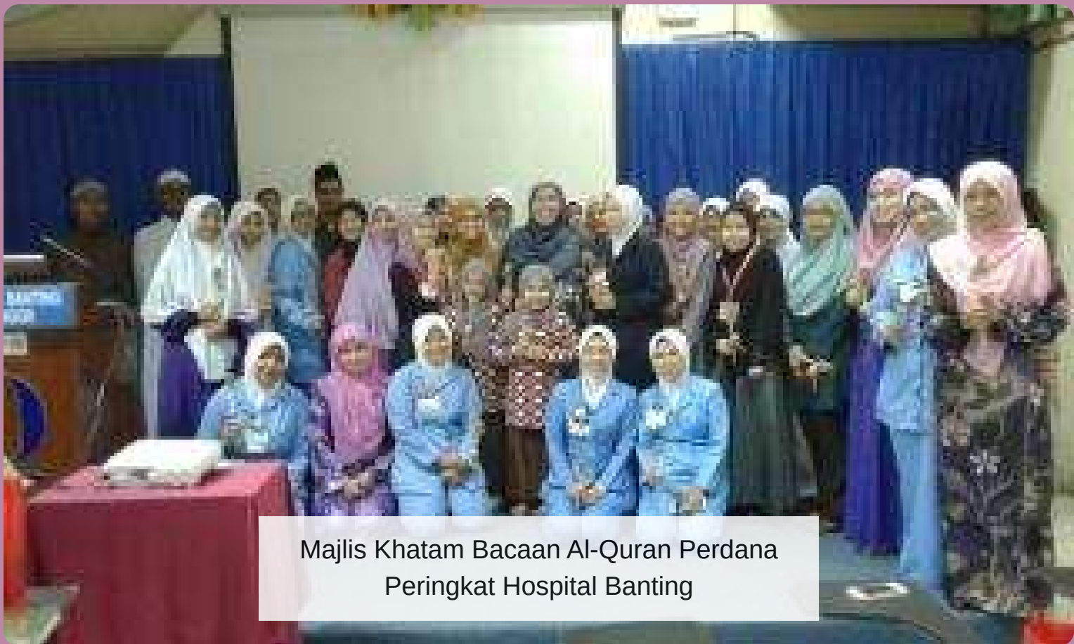
Majlis Khatam Bacaan Al-Quran Perdana Peringkat Hospital Banting