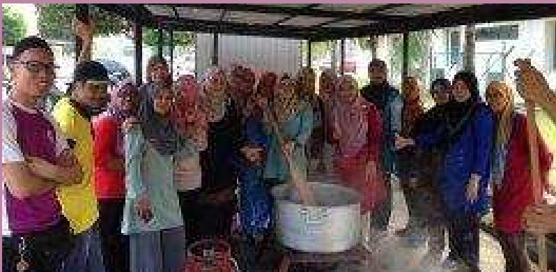
Rewang Bubur Lambuk Peringkat Hospital Banting