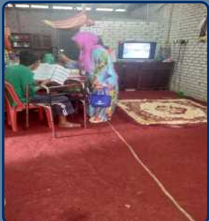
Lawatan ke Rumah Pesakit Bagi Kes Bantuan Praktik dan Terapi Sokongan