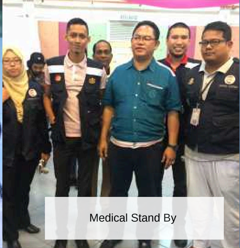
Medical Stand By