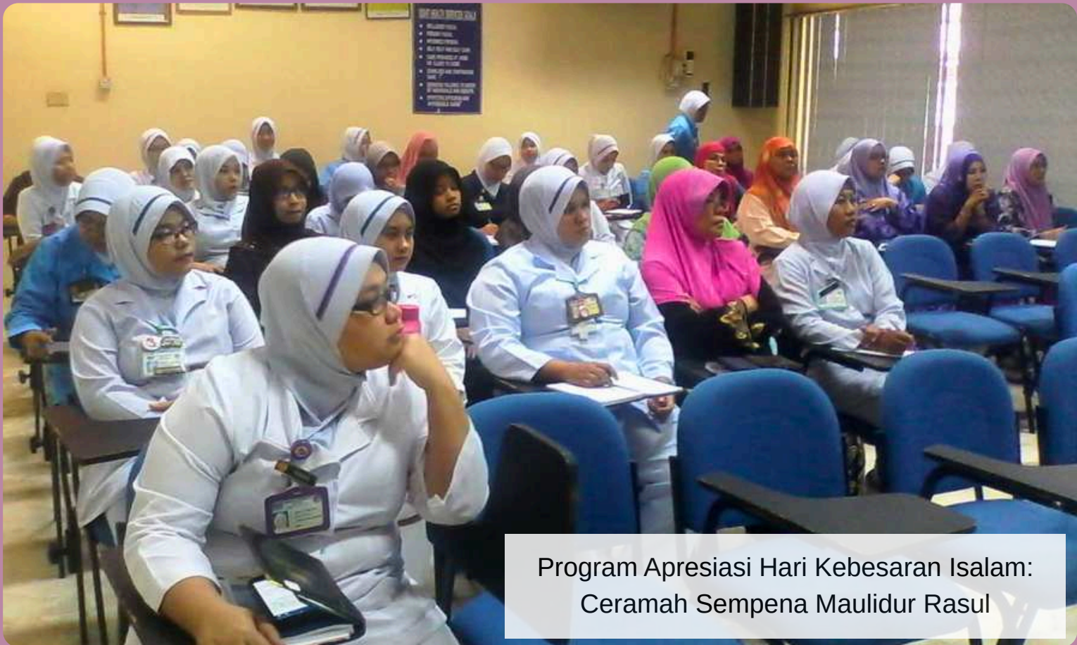
Program Apresiasi Hari Kebesaran Islam: Ceramah Sempena Maulidur Rasul