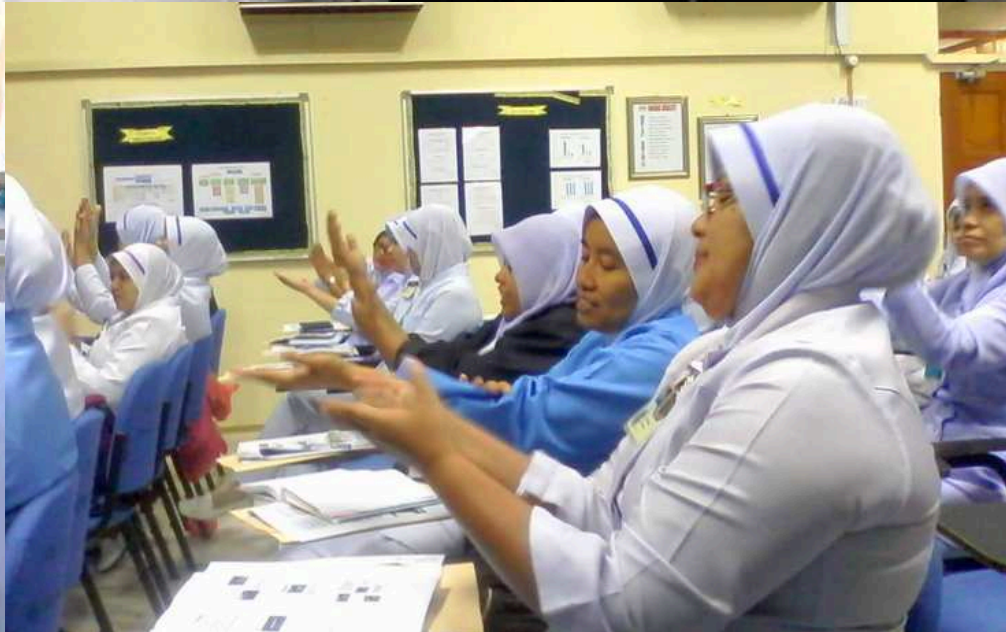
Training of Trainer (TOT) Pengurusan Solat/Ibadah Pesakit, Peringkat Hospital Banting