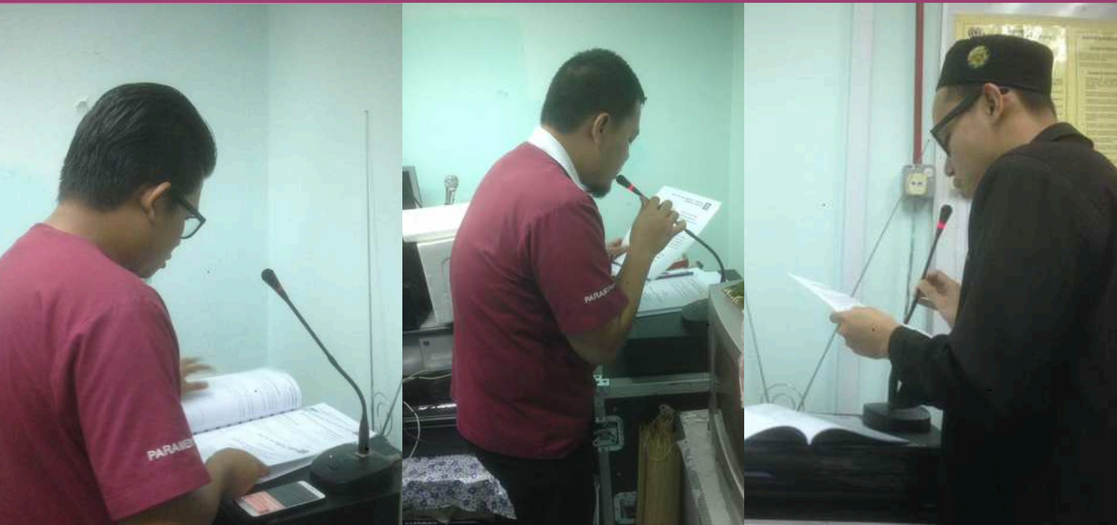
Perlaksanaan Bacaan Doa Pagi dan Pengumuman Masuk Waktu Solat Fardhu Melalui Interkom, dilakukan bermula 2 Januari 2017