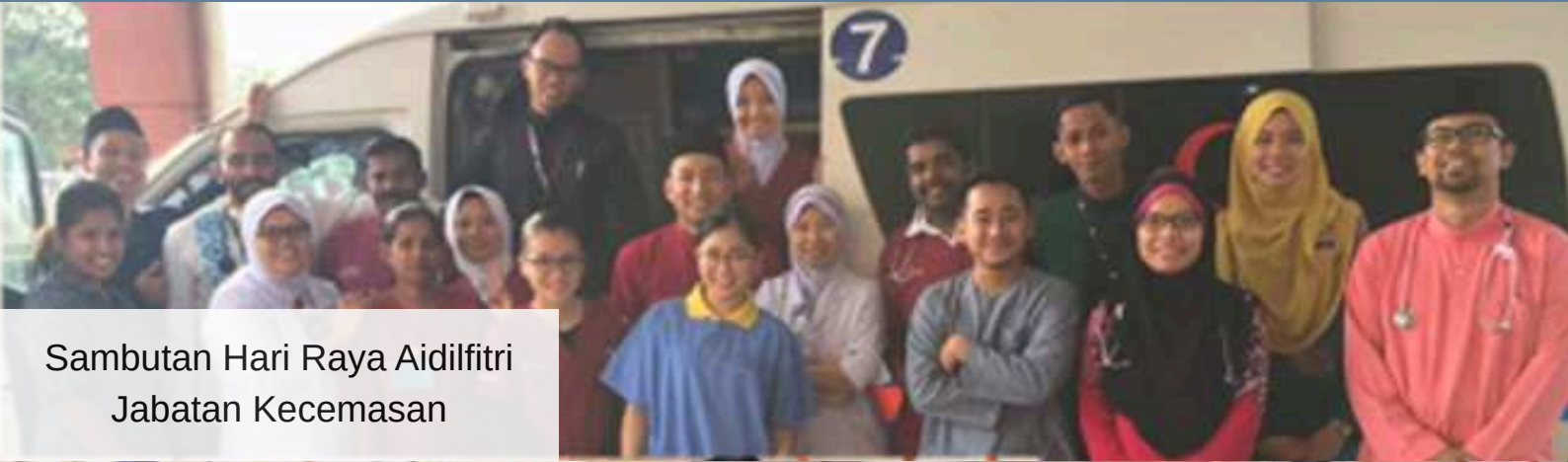
Sambutan Hari Raya Aidilfitri Jabatan Kecemasan