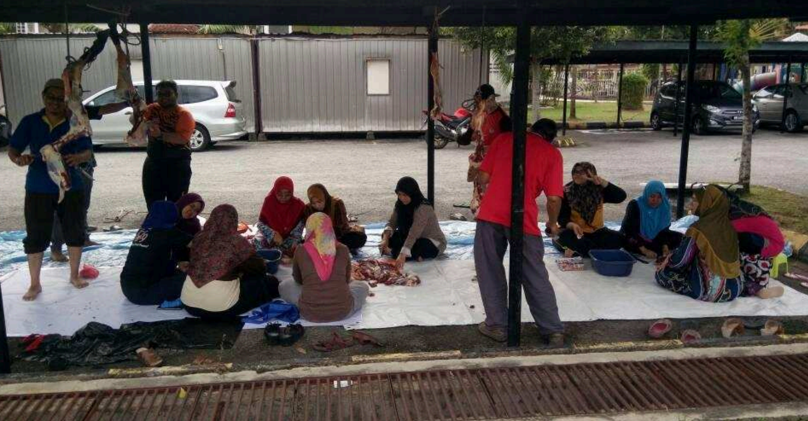
Program Ibadah Qurban Kasih Ummah 1438H/2017M, Peringkat Hospital Banting yang dilakukan pada 2 September 2017 (Sabtu) bertempat di Garaj Bersebelahan Pejabat Rehabilitasi, Hospital Banting