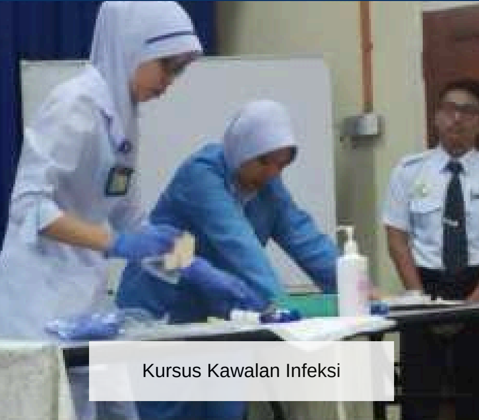
Kursus Kawalan Infeksi