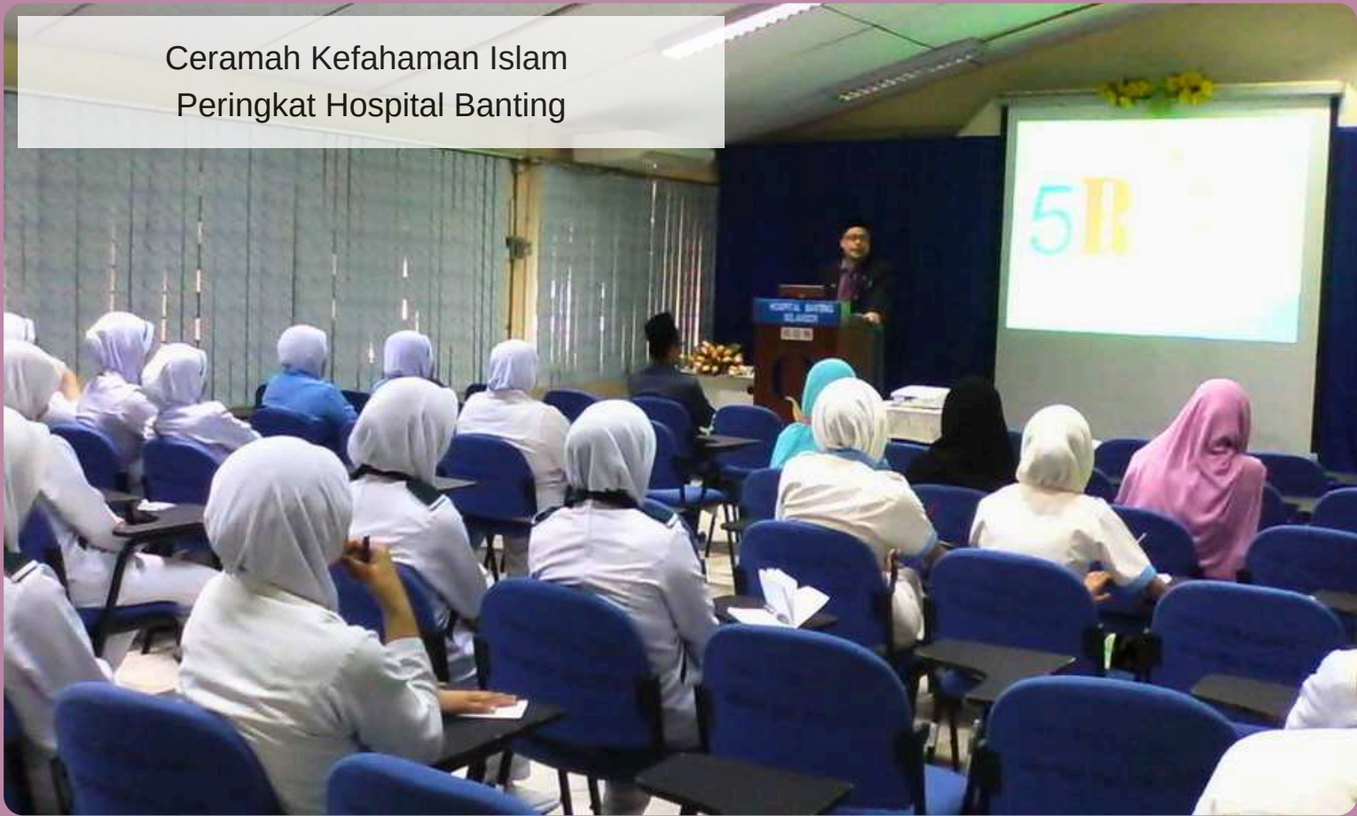
Ceramah Kefahaman Islam Peringkat Hospital Banting