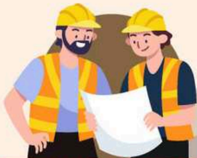
Mereka yang sentiasa bekerja di luar (persekitaran terbuka)