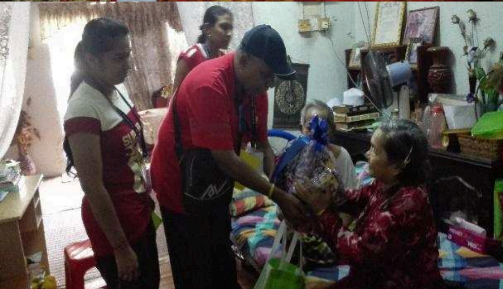
Program 'Know Your Medicine Explorace' yang dijalankan di sekitar Banting