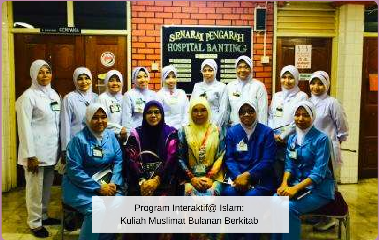
Program Interaktif@ Islam: Kuliah Muslimat Bulanan Berkitab