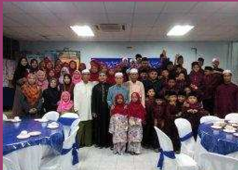
Majlis Iftar Warga Hospital Banting Bersama Anak Yatim/Miskin Rumah Penyayang Bestari, Kampung Sungai Buaya, Banting