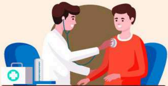
Pesakit Asma, Bronkitis, Radang paru-paru, penyakit paru-paru yang kronik, jantung & alahan

SEGERA DAPATKAN RAWATAN DI FASILITI KESIHATAN JIKA TIDAK SIHAT