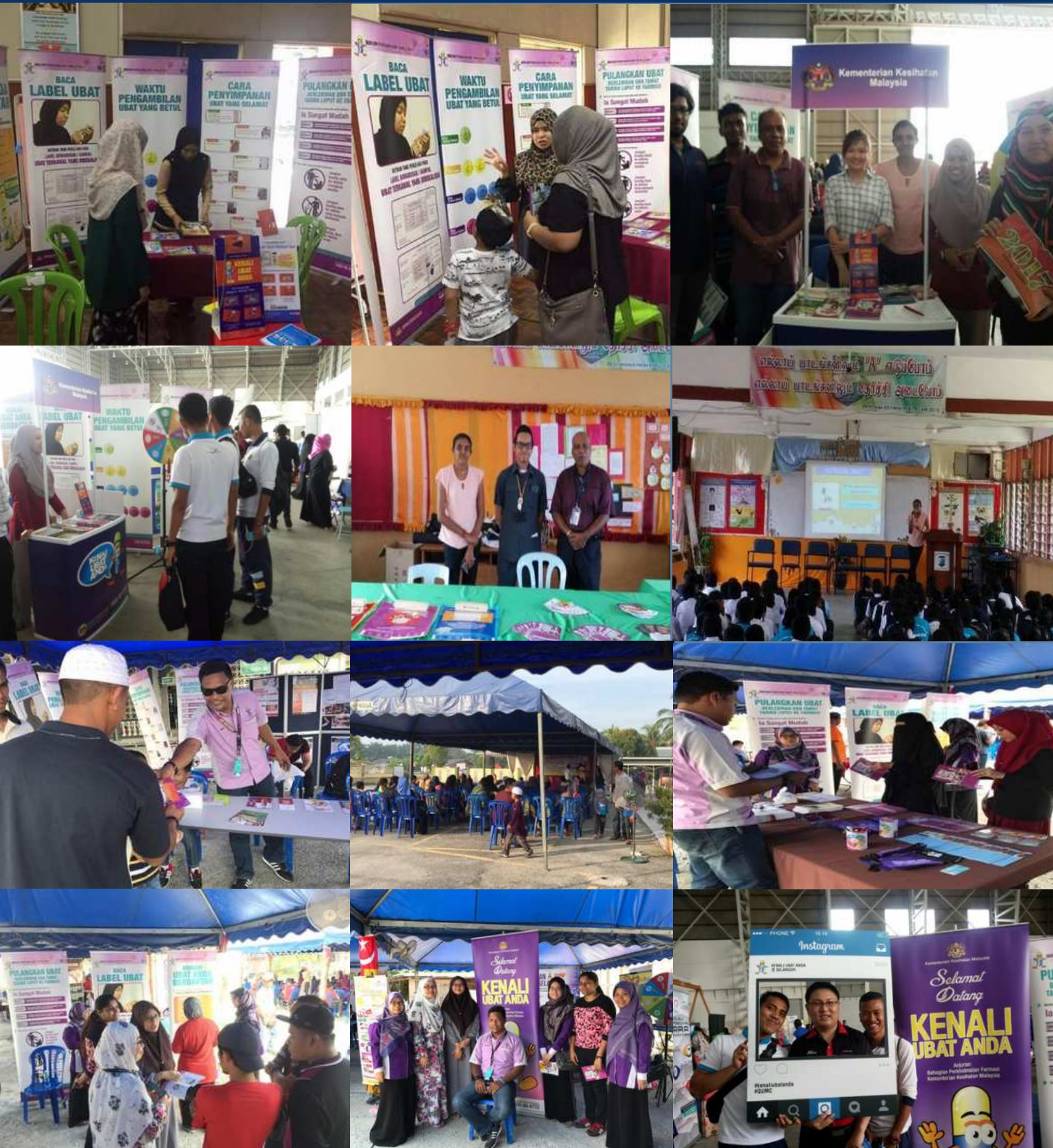
Pameran Kenali Ubat Anda Bersama DUTA Kenali Ubat Anda yang diadakan di Kolej MARA Banting, Politeknik Banting, SJK Tamil Telok Datok, Masjid Kampung Kachong Darat, & Masjid Jamiul Ehsani, Sijangkang