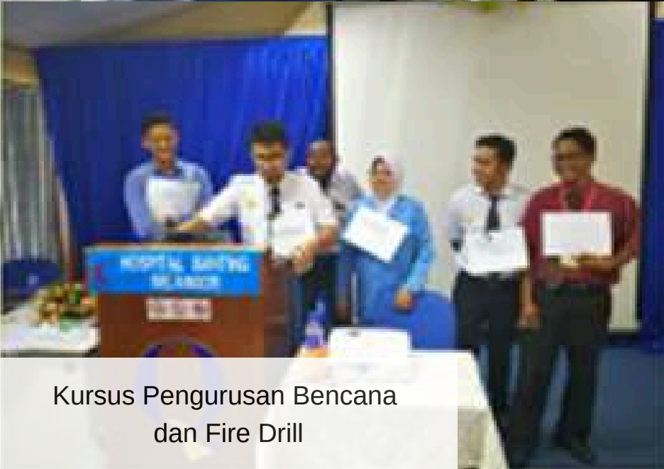
Kursus Pengurusan Bencana dan Fire Drill