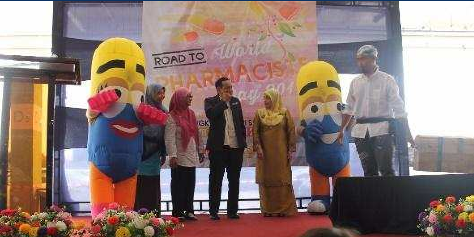
Pelancaran Program 'Road to World Pharmacist Day' Peringkat Negeri Selangor yang diadakan di Tesco Jenjarom, Banting