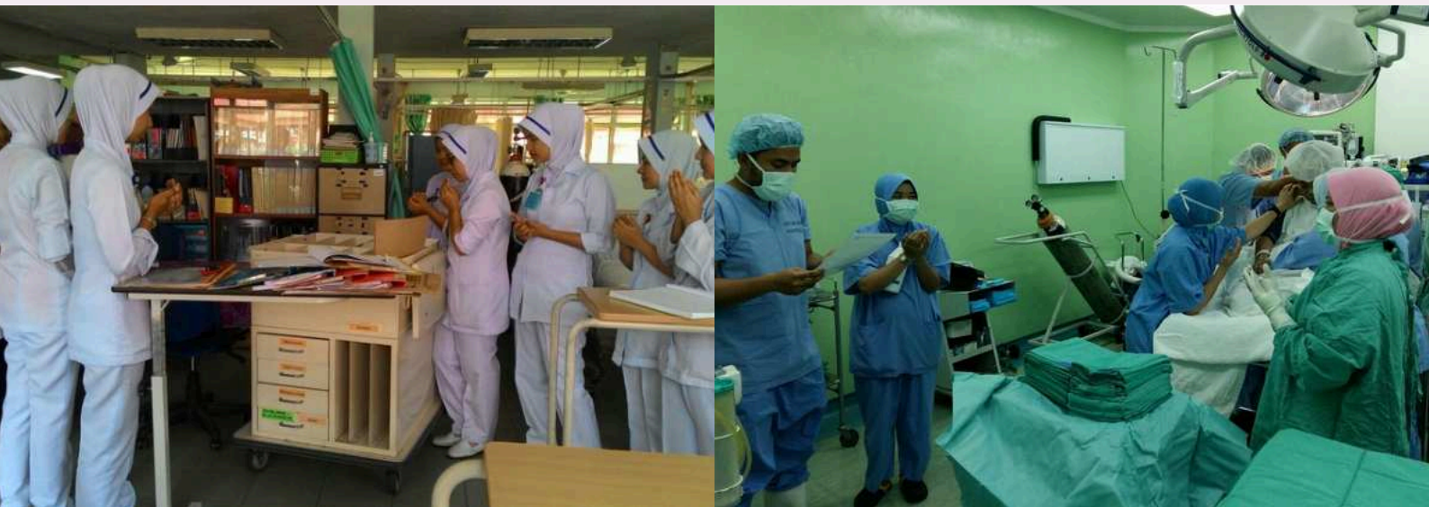
Bacaan Doa Semasa Pertukaran Syif dan Bacaan Doa Sebelum Pembedahan Bermula